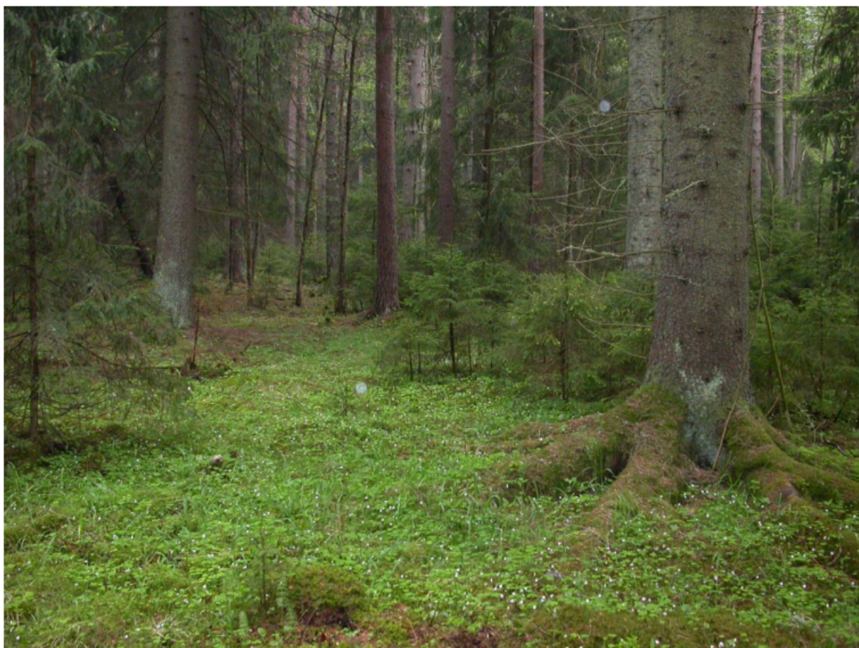
Barrblandskog av lågört-typ är den dominerande vegetationstypen i området. Harsyra dominerar ställvis fältskiktet. 23 maj 2005.

Naturmarkens tillgänglighet för allmänheten förändras inte nämnvärt jämfört med dagens.